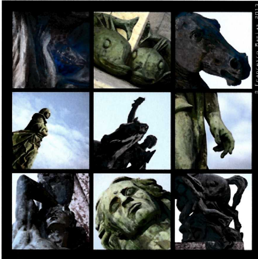
fotografie di Francesco Manias (tesi di Laurea Accademia di BBAA di Genova 2011-12)